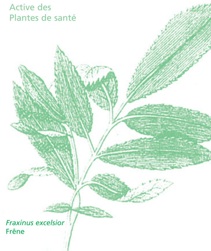
Fraxinus excelsior Frêne

Connaissance Active des Plantes de santé